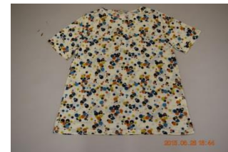
半袖Tシャツ 6000円⇒3000円(税込)