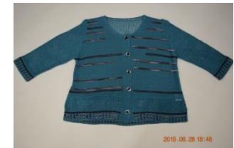
サマーカーディガン 9000円⇒4500円(税込)