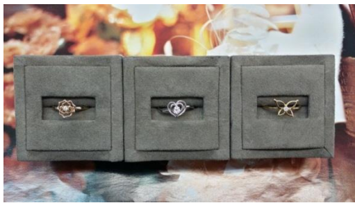
ダイヤモンド(0.1)リング・K18 通常価格¥88000(税込) ⇒特別価格¥51840(税込)