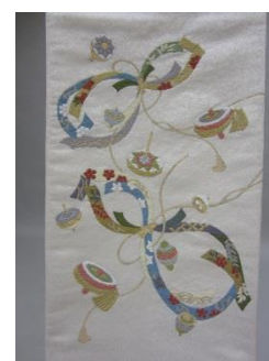
袋帯(お太鼓柄) 通常価格97200円 ⇒特別価格 43200円