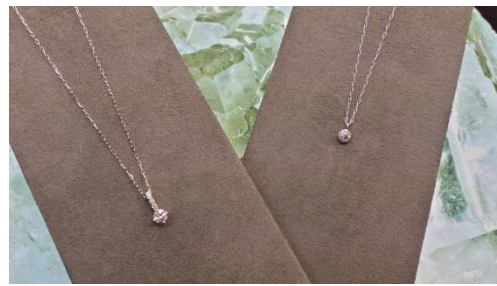
左・ダイヤモンド(0.22)ネックレス・K18 通常価格¥180000(税込)⇒特別価格¥86400(税込) 右・ダイヤモンド(0.1)ネックレス・K18 通常価格¥80000(税込)⇒特別価格¥42120(税込)