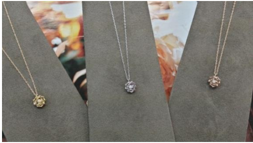
ダイヤモンド(0.03)ネックレス・K18 通常価格¥138000(税込) ⇒特別価格¥51840(税込)