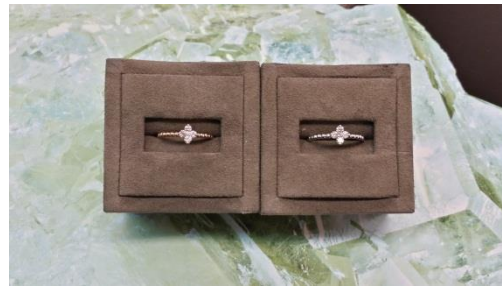
ダイヤモンド(0.21)リング・K18 通常価格¥180000(税込) ⇒特別価格¥95040(税込)